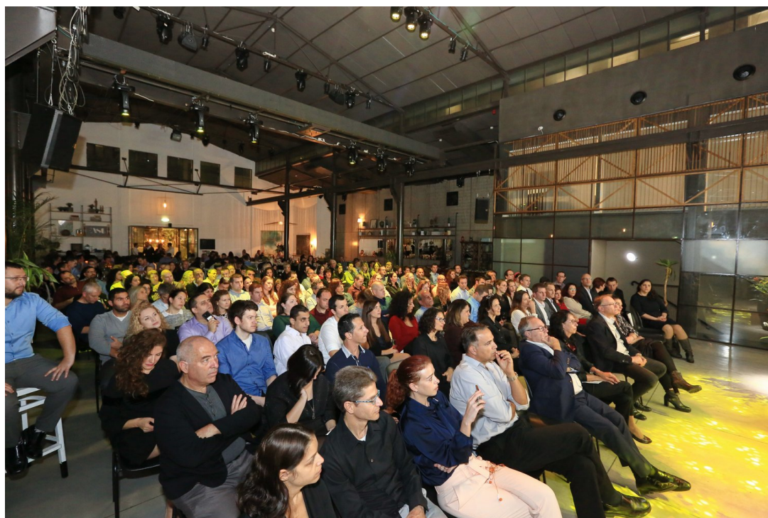
משתתפי כנס אגודת האקטוארים בישראל

חשמונאי הוסיפה כי האגודה הישראלית נמנית על 14 האגודות האקטואריות בעולם אשר ייסדו בשנת 2009 את ארגון CERA GLOBAL, המסמך אקטוארים ובעלי תפקידים בניהול סיכונים תאגידי, המוכר באופן גלובלי בכל המדינות החברות באגודה זו. "השנה במסגרת ההכשרה לתעודת סרה קיימנו לראשונה קורס בניהול סיכונים תאגידי, אשר נוהל על ידי עופר ברנדט ודן בר-און , שניהם חברי CERA", אמרה נשיאת האגודה, וברכה את בוגרי הקורס, אשר סיימו את המחויבויות הנוספות, שקיבלו במהלך הערב לראשונה תעודת CERA.